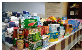
LA SOLIDARIETÀ CRESCe PUNTO ALIMENTARE