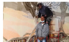
NUOVE COMPETENZE LAVORI SOCIALMENTE UTILI