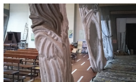
AVANZAMENTO DEL MOSAICO LE COLONNE-ALBERI